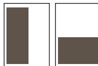
1/2 side 92,25 x 260 mm 185 x 129,5 mm