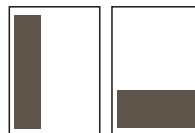
1/3 side 57,5 x 260 mm 185 x 86 mm