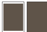
1/1 side 185 x 260 mm 210 x 297 mm