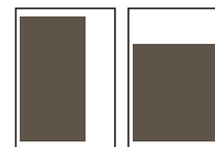
2/3 side 121,25 x 260 mm 185 x 173 mm